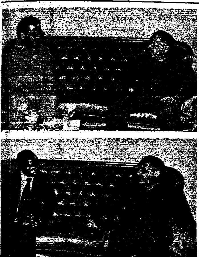
القائد الاول لرئيس الوزراء السيد طه ياسين رمضان لدى استقباله وزير المالية الزامي وثاني رئيس وزراء عراقياداً .

رأس السيد سعورون غيدان عضو مجلس قيادة الثورة وزير النقل والواصلات امس ندوة موعزة لاجراء العمل وتطوير الخطوط الجوية العراقية والمطارات المحلية لانتظار خطة العمل في تطوير وتطويره والاستعدادات اللازمة لتشغيل وادارة مطار بغداد الدولي الجديد الذي سيستقبل العام المقبل . وشارك السيد عضو مجلس قيادة الثورة الى اتخاذ السيد لخيران النجدي والمنظمة العامة والادارية واقامة الدورات المركزة لتطوير وتطوير الخدمات التي تقدمها لعملائها بما يؤمن نجاحهم . وحضر الندوة عدد من المسؤولين في الوزارة والمؤسسة العامة للطيران المدني والخطوط الجوية العراقية ومهندسين ومطوري الخدمات التي تقدمها لعملائها بما يؤمن نجاحهم .